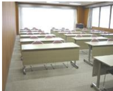
<小会議室 1・2> 机 20台、椅子 40脚