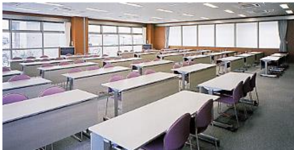
<大会議室> 小会議室 2つで一室使用