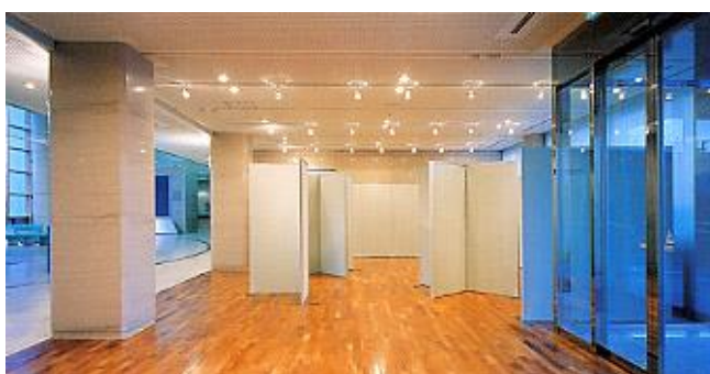
<ギャラリー> 広さ 7.8m x 9m