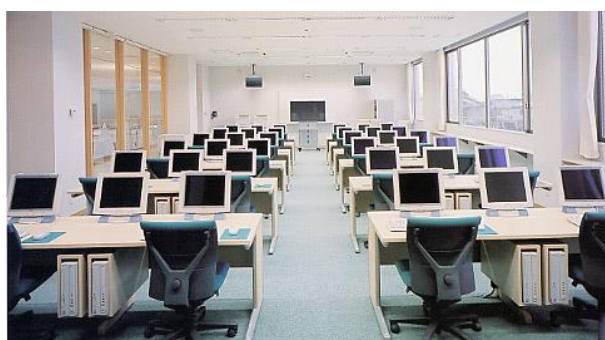
<コンピュータ研修室> PC 24台設置