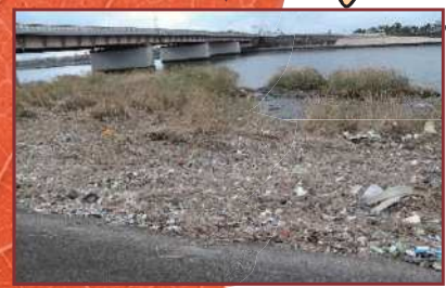
ますますゴミが増える