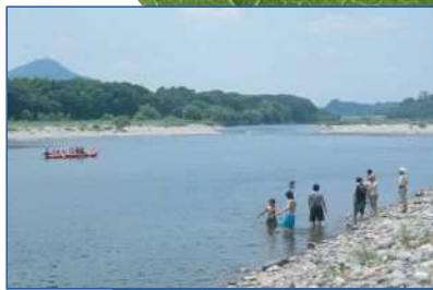
いつまでもきれいな水辺